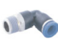
PL 90 KOLENO kód 55003