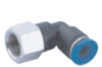
KOLENO PLF kód 55008