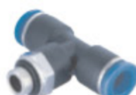
PŘÍPOJKA T PT kód 55033