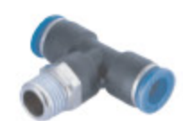
T-SPOJKA PT90 kód 55004