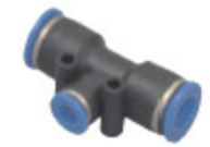
SPOJKA T-R PGT kód 55012