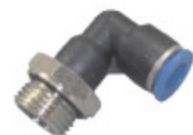
PŘÍPOJKA KOLENO PL kód 55032