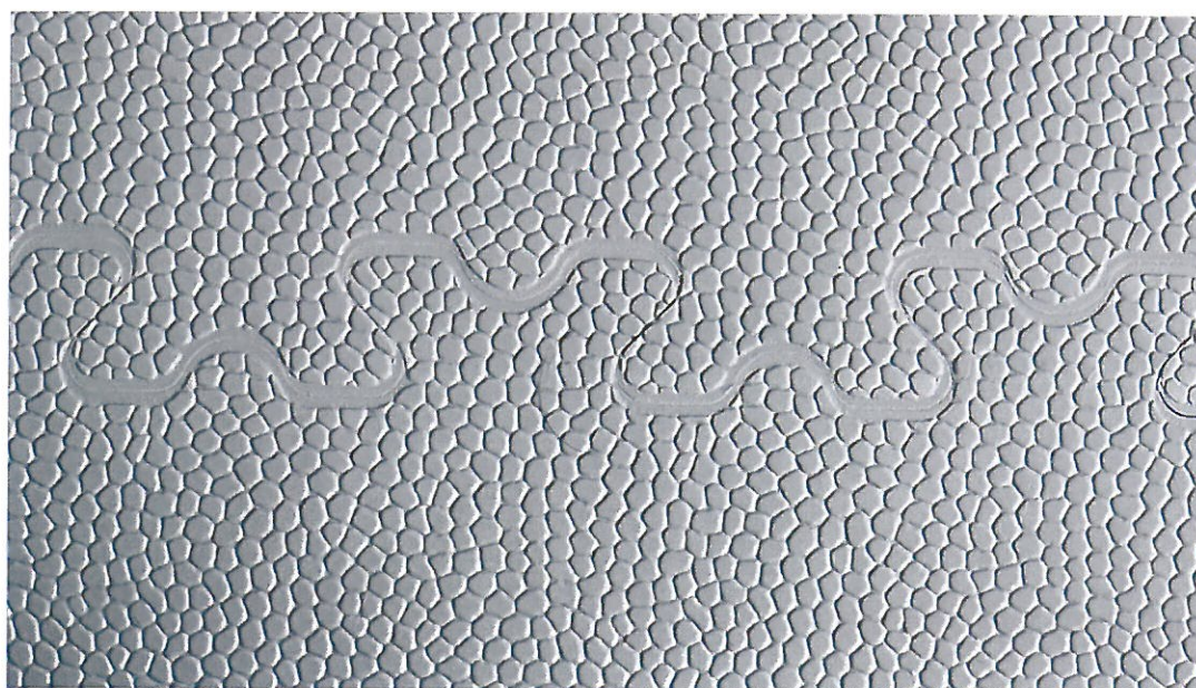
obr. 4 - lícová strana vzorku – spoj dvou dlaždic