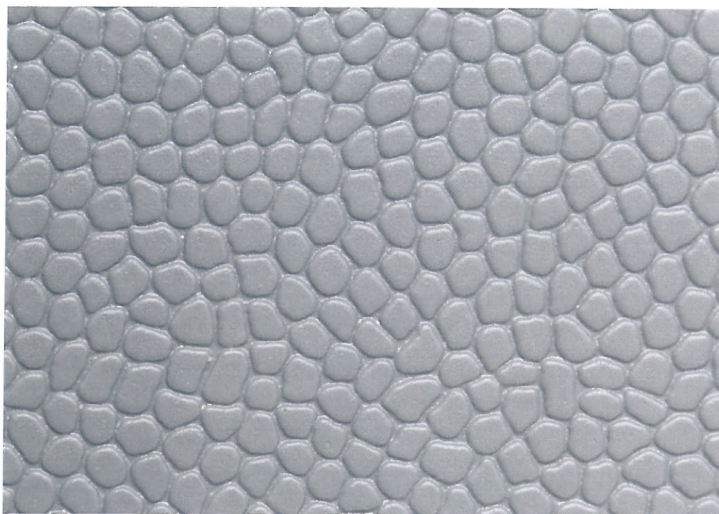
obr. 3 - lícová strana vzorku - povrch